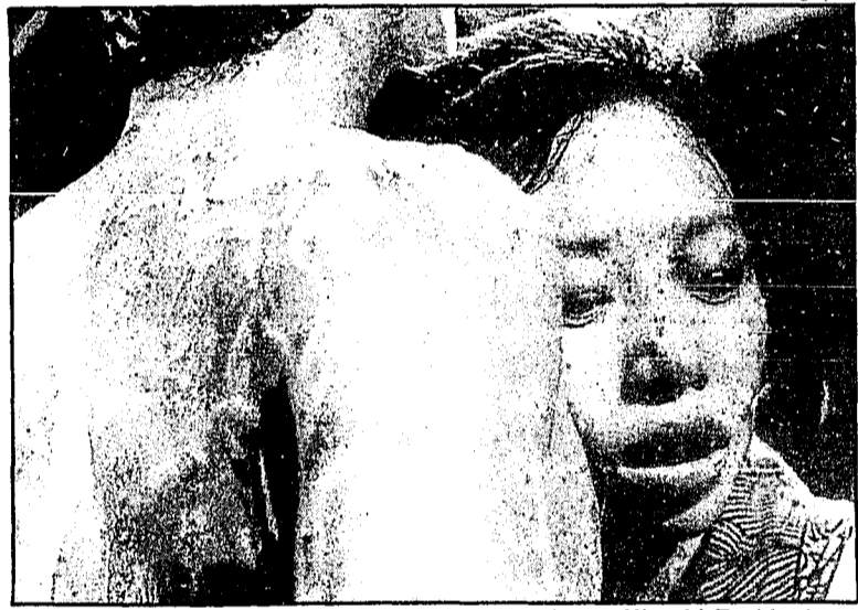
Cena de "A mulher da areia", filme de 1964 do diretor Hiroshi Teshigahara

As relações entre cineastas e escritores, freqüentemente conflituosas no Ocidente, são em geral harmônicas na produção japonesa. É o que veremos, de hoje ao dia 28, através dos 11 filmes (com legendas em inglês) da preciosa mostra "Japão: cinema e literatura", no CCBB (Centro Cultural Banco do Brasil). Mais da metade do programa permanece desconhecida de nosso público, por causa da precariedade que sempre acompanhou a distribuição dos filmes dessa origem. A seleção inclui produções de 1956 a 1986. E três são rigorosamente inéditas: "Adeus à arca", "Desde então" e "Mar e veneno". Entre os não inéditos há pelo menos dois grandes títulos: "A mulher da areia", de Hiroshi Teshigahara (Prêmio Especial do Juri em Cannes, 1964), um dos maiores filmes de todos os tempos, obra de gosto kafkiano baseada no romance de Kobo Abe, e "Não esquecerei os mortos"