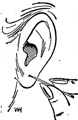
com um chumaço de algodão embebido em álcool.

É possível contrair-se hepatite através da perfuração das orelhas com instrumentos que não estejam adequadamente esterilizados. Até aqui sabia-se de casos ocorridos depois da realização de tatuagens, mas os resultados da perfuração dos lábios da orelha são novidade.